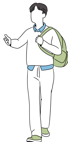
一人暮らしの Aさん