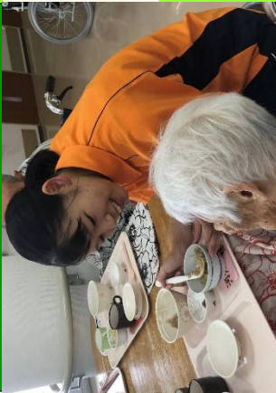
介護職育成に向けた施設実習