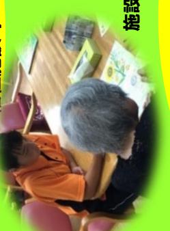
施設での介護実習

本校専攻科(高校卒業対象・2年制)、福祉系大学、短期大学、専門学校、福祉施設等への就職