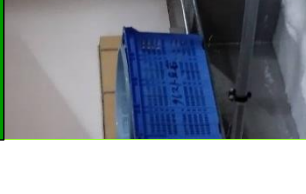
校内販売実習準備