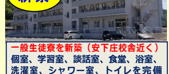
一般生徒寮を新築(安下庄校舎近く)個室、学習室、談話室、食堂、浴室、洗濯室、シャワー室、トイレを完備