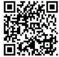
学校ホームページ