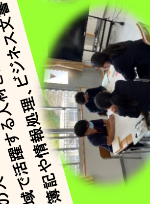
ビジネスプランの検討