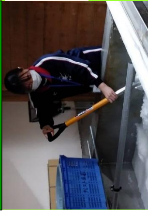
商品開発に向けた塩づくり体験