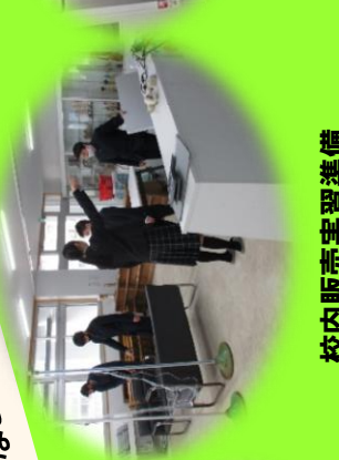
校内販売実習準備