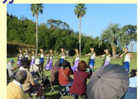
【アロハ・フラ島高】