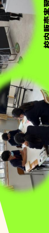
校内販売実習準備

○地域の人々の力を借りた商品開発・販売促進【6次産業体験】 ○地域で活躍する人材を招いた実践的な授業 ○地域で活躍する人材を招いた実践的な授業