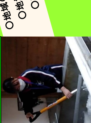
商品開発に向けた塩づくり体験