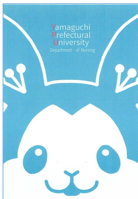
今年度のファイルデザイン