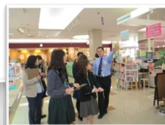
企業等との課題取組で得た成果

2023年2月16日(木)14:00～16:40 山口県立大学2号館B401教室 (ZOOMによる参加も可)