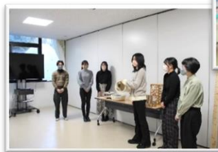
企業等への新たな提案