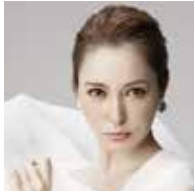
藤井リナ (ふじい・りな)

アジア全域で人気を誇るアジアを代表するファッションモデル。2014 年の AAF でもゲストモデルとしてランウェイを歩き、今年で 2 回目の出演となる。中国で売り上げ No.1 のファッション雑誌でも企画が好況となり、連続起用されている。TV や映画、CM など幅広い分野にて大活躍中。