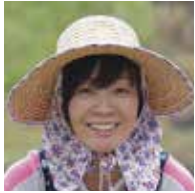
安倍昭恵 (あべ・あきえ)

アグリアート・フェスティバル名誉理事長。内閣総理大臣安倍晋三夫人。聖心女子学院幼稚園から高等学校卒業。聖心女子専門学校英語科卒業。立教大学大学院 21 世紀社会デザイン研究科修了。株式会社電通新聞局を経て 1987 年安倍晋三氏と結婚。趣味は、ランニング、ゴルフ、お米づくり、薙刀。