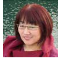
水谷由美子 (みずたに・ゆみこ)

アグリアート・フェスティバル名誉理事長。内閣総理大臣安倍晋三夫人。聖心女子学院幼稚園から高等学校卒業。聖心女子専門学校英語科卒業。立教大学大学院 21 世紀社会デザイン研究科修了。株式会社電通新聞局を経て 1987 年安倍晋三氏と結婚。趣味は、ランニング、ゴルフ、お米づくり、薙刀。