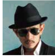
DOZAN11 (どうさんいれぶん) 《友情出演》

アジア全域で人気を誇るアジアを代表するファッションモデル。2014 年の AAF でもゲストモデルとしてランウェイを歩き、今年で 2 回目の出演となる。中国で売り上げ No.1 のファッション雑誌でも企画が好況となり、連続起用されている。TV や映画、CM など幅広い分野にて大活躍中。