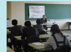
三大学合同SD研修会