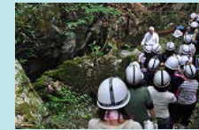
秋吉台・周防大島へのフィールドワーク