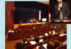
地域学開講基調講演