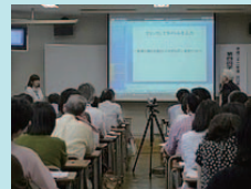
三大学合同FD研修会