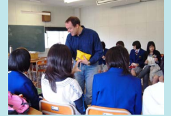
高校生の授業参観