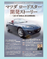
本事業の技術を使って 中継する講演