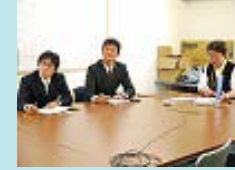
高校と大学の教員による教材開発