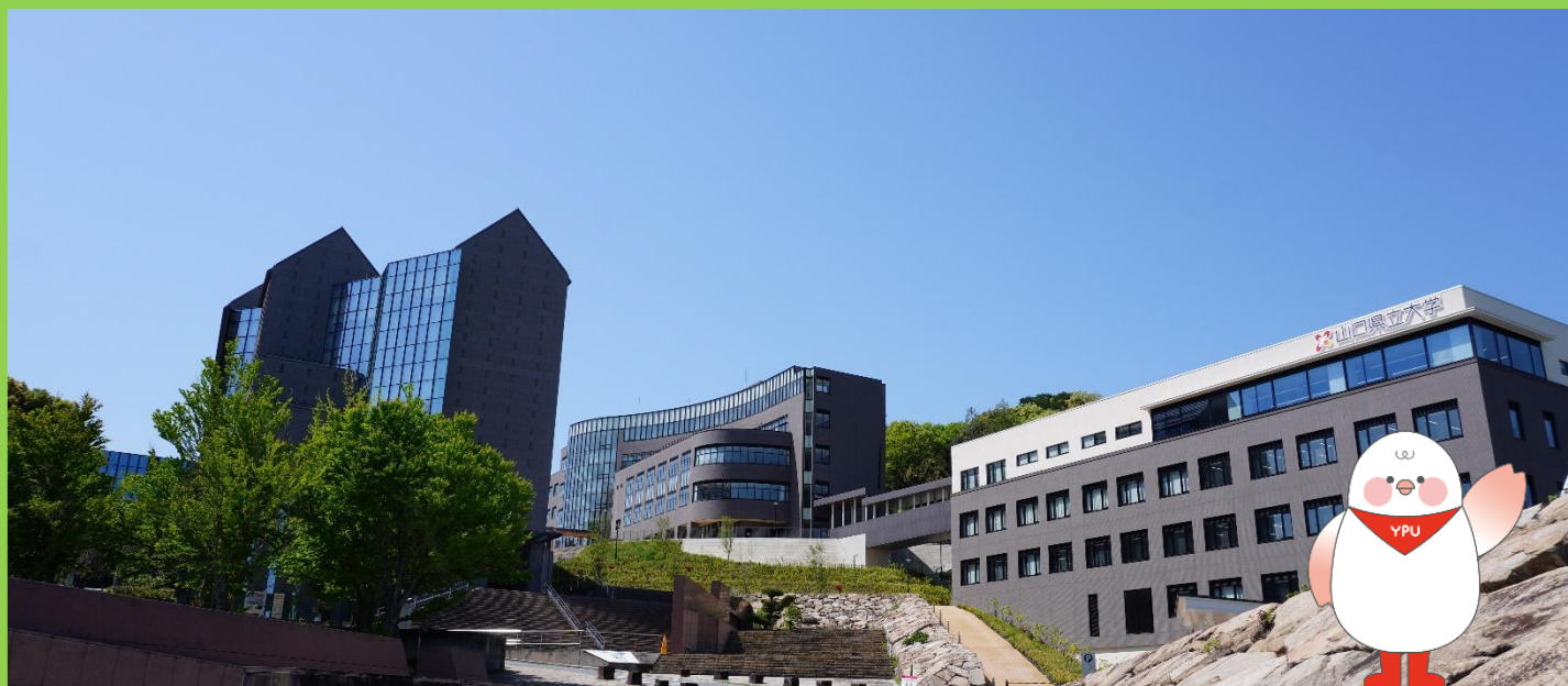
山口県立大学公式マスコットキャラクター 「わいびよ」