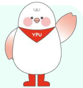
山口県立大学公式 マスコットキャラクター 「わいびよ」

*「授業の概要メモ」とは、授業名、対象学年・人数、授業のねらい、当日の授業の流れ(箇条書きでOK)、困っている点(1つ~3つ)、改善したい点などが書かれているA4、1枚程度のメモのことで