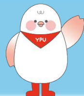
山口県立大学 公式マスコットキャラクター 「わいびよ」