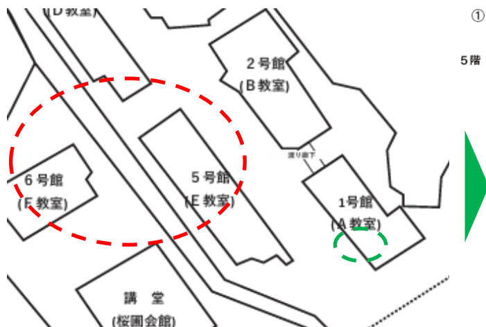
① 1号館 (A教室)