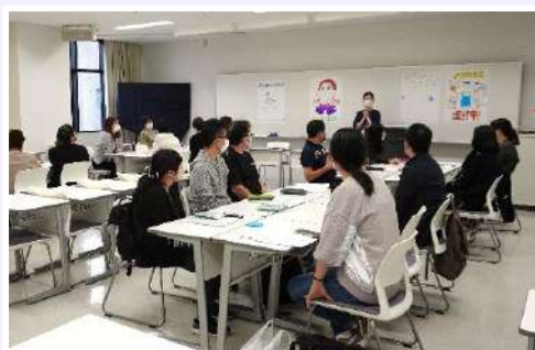
グループ演習では、アウトブレイク発生時の対応についてシミュレーションしました。(昨年度の様子)

通所サービスも含む高齢者保健福祉施設における感染対策の基本的知識や高齢者施設で多発する感染症に応じた対策の実際を学びます。また、新型コロナウイルス感染症を含む高齢者施設で多発する感染症を防止するための平常時の対策及び発生時の対応についてシミュレーション演習を行います。