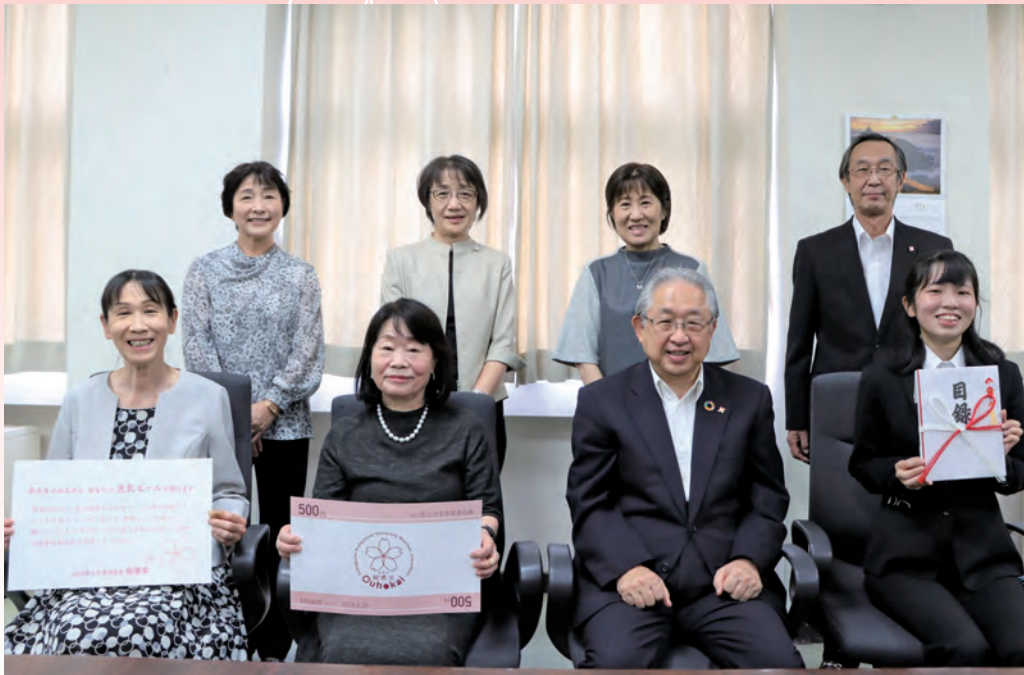
生協商品券贈呈式 2022年(令和4年)9月28日 (於) 理事長室