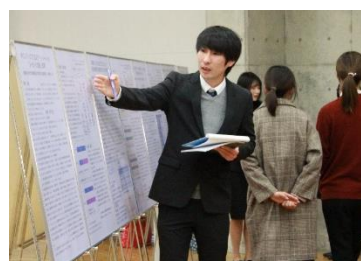
←ポスターセッション