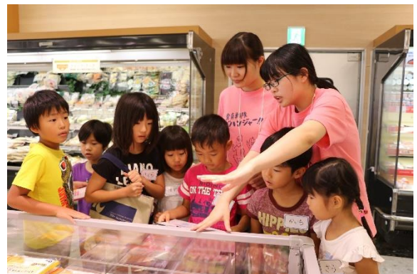
「食育戦隊ゴハンジャー」活動の様子

【内 容】9：15 開会あいさつ・アイスブレイク 9：35 たこについての説明 11：05 コープここと いずみ店にて買い物 11：55 調理 12：45 食事・片付け 14：00 ふりかえり 14：50 閉会あいさつ