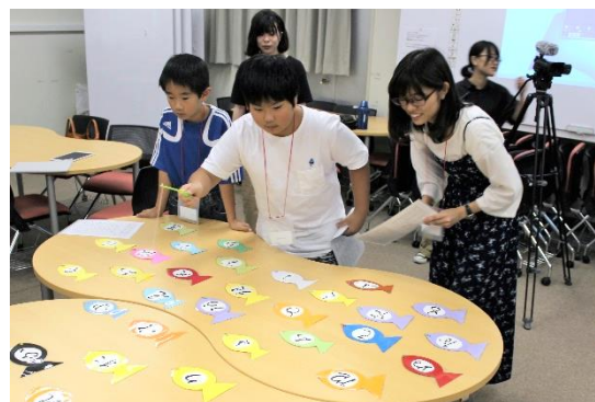
▲昨年の「こどもくずし字教室」の様子