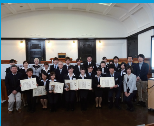
第3回フォーラムにて (平成28年1月開催)