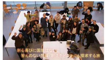
欧州/北欧デザイン文化研修(デンマーク・フィンランド)