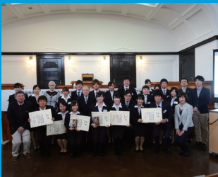
第3回フォーラムにて (平成28年1月開催)