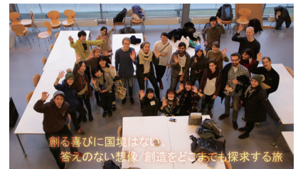
欧州/北欧デザイン文化研修(デンマーク・フィンランド)