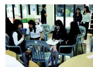
韓国チャンドンでのワークショップ風景