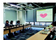
台湾での企画案プレゼン風景