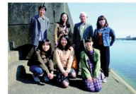
岩国市雁木船着場(サビエルの足跡)