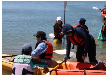
今年度の様子(海辺アクティビティ)