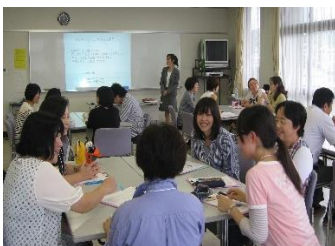
今年度の様子(異世代コミュニケーション)

柔軟でユニークな教育内容により、楽しみながら子どもとの遊び方や心の健康維持の技法等、子育て支援者としてのスキルなどを修得し、自分と周囲の人々の「育ち合い(愛)」のための知識と技術を有する人材の育成を行います。