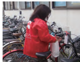
放置自転車の判別のための全自転車への札付け