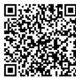
学生スタッフ最新情報

募集は、掲示とホームページで随時行っています。こまめにチェックしてみてください。申し込みは学生活動支援センターの窓口へ。