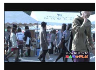
C-able 山口ケーブルテレビジョン 「やっちょる! でちょる! みんなのテレビ」

水無月祭に引き続き、華月祭2日間の模様を撮影編集しました。テーマは「笑顔とその思い」です。撮影を通じて大学祭に対する学生の様々な思いに触れて、私たちは学生の今、この瞬間を形にする使命感と充実感を感じました。作品は後日 C-able 山口ケーブルテレビジョンにて放映されました。