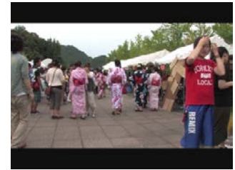
C-able 山口ケーブルテレビジョン 「やっちょる! でちょる! みんなのテレビ」

“フラメンコ部”からの依頼により留学する部員に水無月祭の舞台をDVDにしてお渡しする企画に取り組みました。映像班はステージ発表の映像提供・編集に取り組みました。デザイン班はフラメンコ部DVDジャケット制作を担当しました。