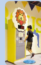
2 耳すましのライオン