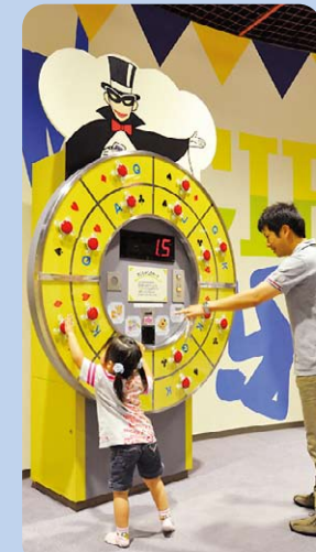
1 マジシャンのカード