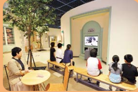
2 ダビンチのザけんこう