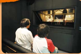
1 ジオラマ劇場 私たちのからだのふしぎ