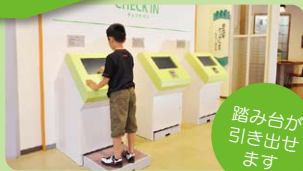
1 健康クイズ1 [3台] 私たちのからだのふしぎ