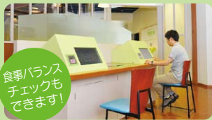
2 健康クイズ2 [6台] 食生活をチェックしよう