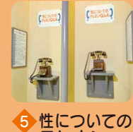
5 性についての テレホン Q&A