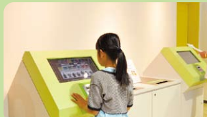
8 健康クイズ集計8 「健康クイズ」集計コーナー