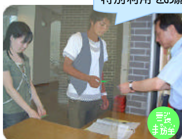
カードキーを借りる

特別利用時間中に学生証と許可証を持って看護事務室へ。 貸出簿に記入して 警備員さん からカードキーを借りてください。