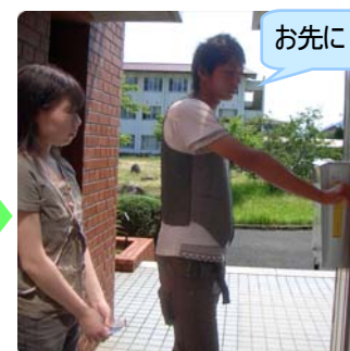
カードキーで入館する

通常の閉館時間から引き続き特別利用する場合は 閉館時間に一旦退館 してください。