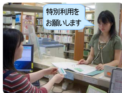
カードキーを借りる

閉館 30分前 までに 学生証と許可証 を持って本館カウンターへ。⚠️ カードキーは借りた館(室)でしか使用できません!