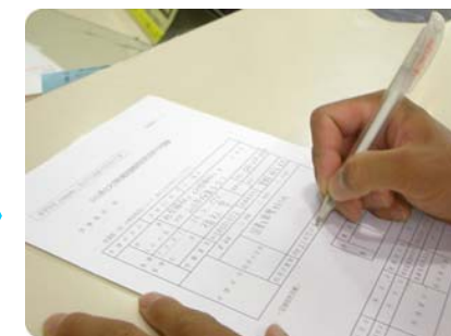
特別利用許可申請書に記入する

許可証の発行・更新は本館カウンターで受け付けます。許可証は 年度更新 です。⚠️ 期限切れの許可証は使用できません!