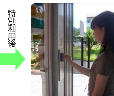
カードキーで退館する