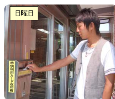
カードキーを返却する

土曜日・日曜日はカードキーを借りることができません。 金曜日 に借り、 利用最終日までカードキーを持ってください 。⚠️ 絶対に紛失しないこと!