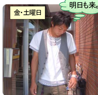
カードキーを持ち帰る

本館で 土曜日・日曜日 に特別利用をしたい場合は 金曜日 に手続きをしてください。