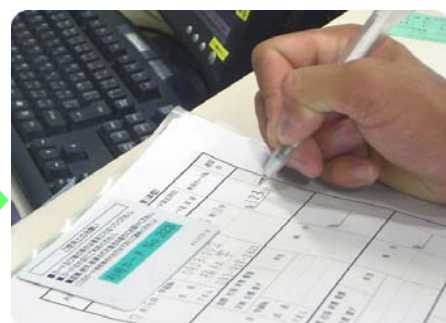
貸出簿に記入する

閉館 30分前 までに 学生証と許可証 を持って本館カウンターへ。⚠️ カードキーは借りた館(室)でしか使用できません!