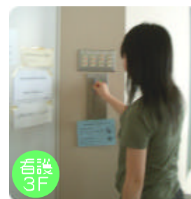
カードキーで退室する