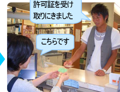
許可証を受け取る

申請書を提出した 次の開館日午前9時以降 に本館カウンターへ 学生証 を持って受け取りに来てください。