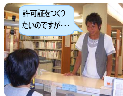
許可証の発行を申し込む

許可証の発行・更新は本館カウンターで受け付けます。許可証は 年度更新 です。⚠️ 期限切れの許可証は使用できません!