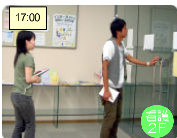
閉館時間に一旦退室する

通常の開館時間から引き続き特別利用する場合は 閉館時間に一旦退館してください。 ⚠️ 貴重品を放置しないこと!