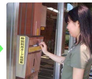
カードキーを返却する

退館後、出入口横にある 返却箱 にカードキーを返却してください。⚠️ カードキーの貸出期間は当日のみ です。(※土曜日・日曜日を除く) 必ず返却すること!