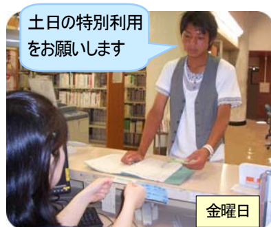
カードキーを借りる

本館で 土曜日・日曜日 に特別利用をしたい場合は 金曜日 に手続きをしてください。