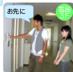
カードキーで入室する

特別利用時の出入口は 3F にあります。カードキーを使って必ず 一人ずつ入室してください。