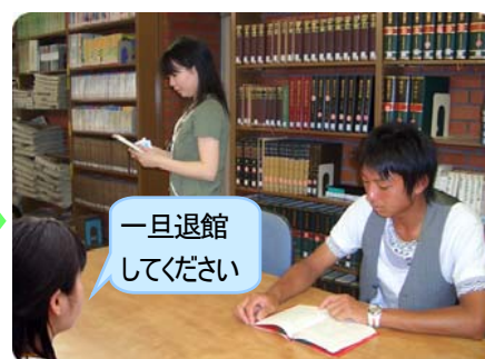
閉館時間に一旦退館する

通常の閉館時間から引き続き特別利用する場合は 閉館時間に一旦退館 してください。