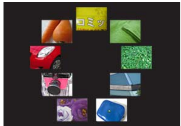
身の回りにある物で「色相環」を制作。どのような物にどのような色が付いているのか等、色をキーワードに日常を見つめ直す。