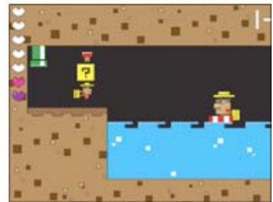
3年生展 「色彩」をテーマに映像作品を制作。