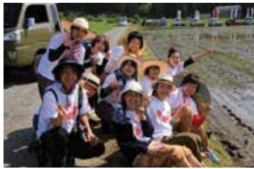
モンベッコプロジェクトメンバーと仲間たち

日本の伝統作業着「もんぺ」は、かつていろんな呼び方があり、その1つに「ハカマッコ」がありました。またフィンランド語で「メッコ」は「ジャレた服」の意味があります。「もんぺ」×「ハカマッコ」×「メッコ」こうして「モンベッコ」が生まれました。