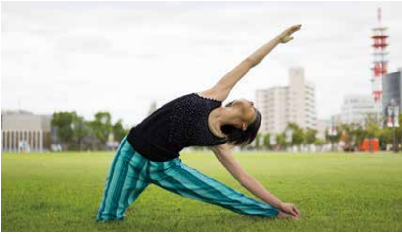
モンベッコ Mori〜森〜ヨガスタイル